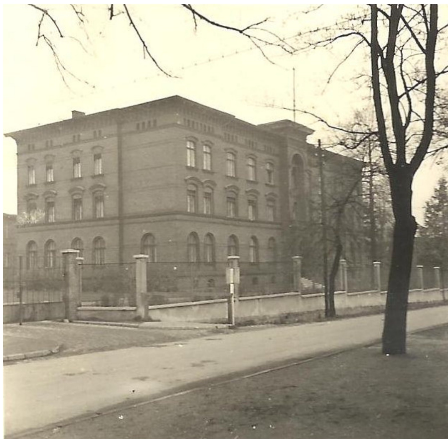
Budynek administracji od strony ul. Gliwickiej