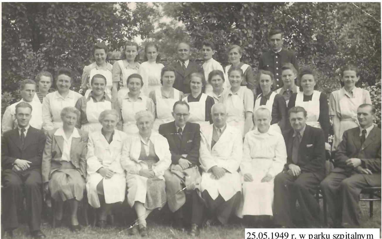
25.05.1949 r. w parku szpitalnym