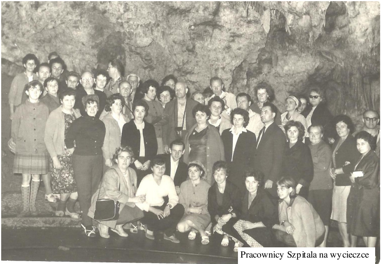
Pracownicy Szpitala na wycieczce